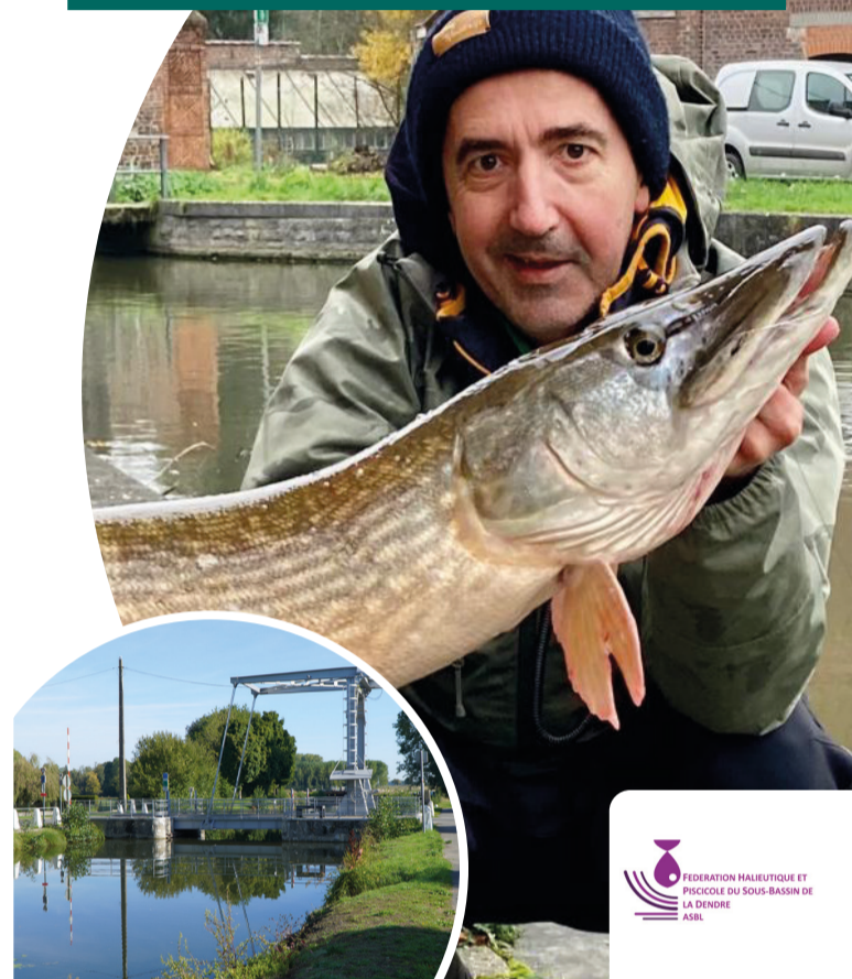
FÉDÉRATION HALIEUTIQUE ET PISCICOLE DU SOUS-BASSIN DE LA DENDRE ASBL