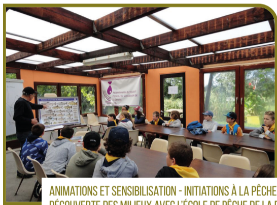
ANIMATIONS ET SENSIBILISATION - INITIATIONS À LA PÊCHE ET DÉCOUVERTE DES MILIEUX AVEC L'ÉCOLE DE PÊCHE DE LA FÉDÉRATION