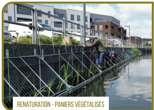
RENATURATION - PANIERS VÉGÉTALISÉS SUR LE CANAL EN CENTRE-VILLE D'ATH