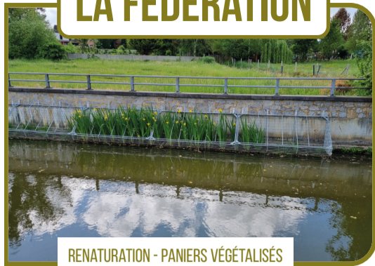
RENATURATION - PANIERS VÉGÉTALISÉS SUR LA DENDRE À LESSINES