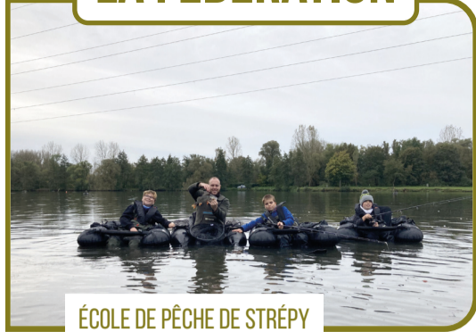
ÉCOLE DE PÊCHE DE STRÉPY