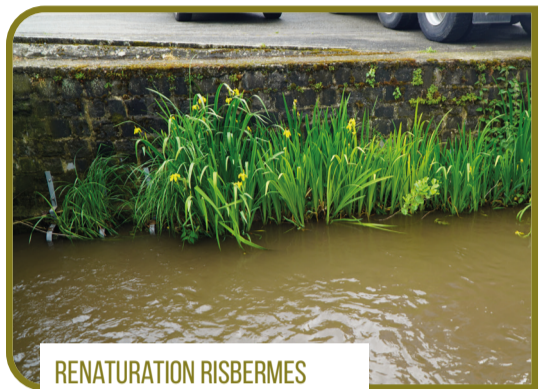
RENATURATION RISBERMES VÉGÉTALISÉES SUR LA TROUILLE