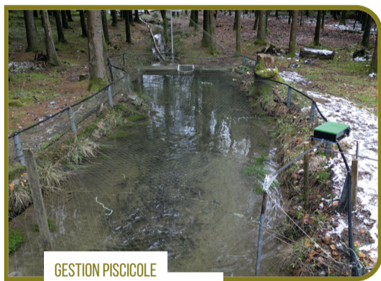
GESTION PISCICOLE PISCICULTURE DE MARENWEZ