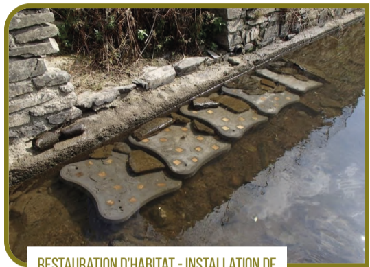
RESTAURATION D'HABITAT - INSTALLATION DE CACHES À POISSON SUR LA SÛRE