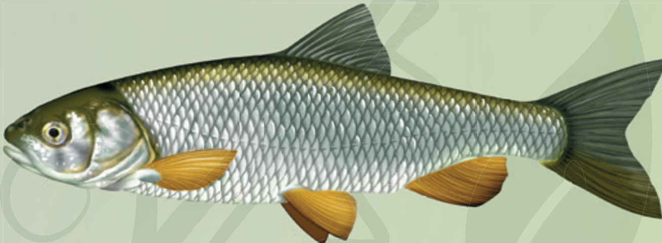
© Illustration de poisson / R.J. Dunbar

Le chevaine possède un corps cylindrique, allongé et robuste. Son dos est légèrement bombé. Ses écailles, dorées à blanchâtres, sont grandes et liserées de noir (bord foncé). Sa tête est massive, munie d'une large bouche. Sa nageoire anale présente un bord convexe.