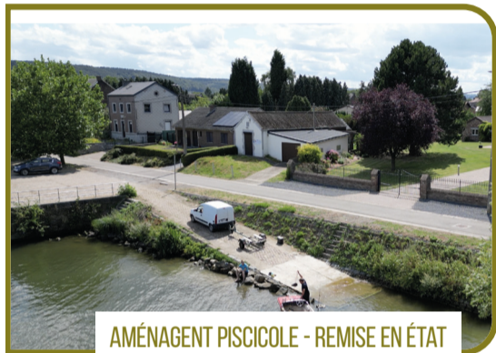
AMÉNAGEMENT PISCICOLE - REMISE EN ÉTAT D'UNE RAMPE DE MISE À L'EAU À FLÔNE