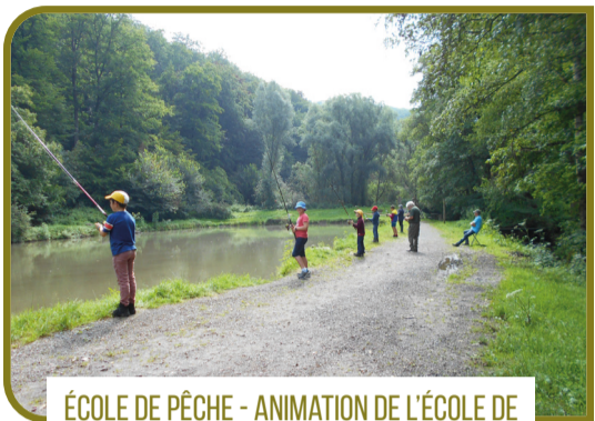
ÉCOLE DE PÊCHE - ANIMATION DE L'ÉCOLE DE LA BASSE-MEUSE LIÉGEOISE